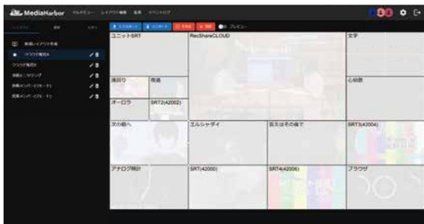
レイアウト編集画面