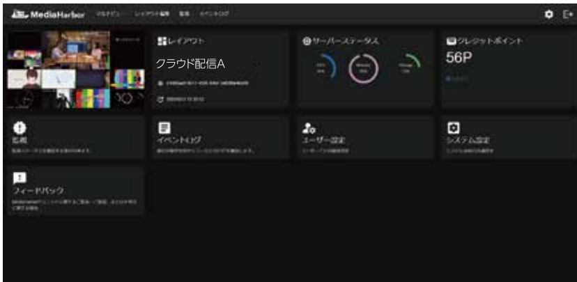
MediaHarbor TOP ページ