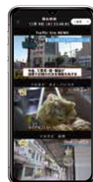
スマートフォン画面